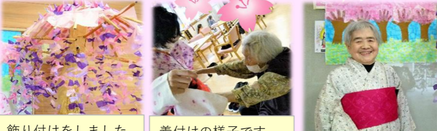
飾り付けをしました。