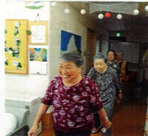
回オリンピック、入場行進