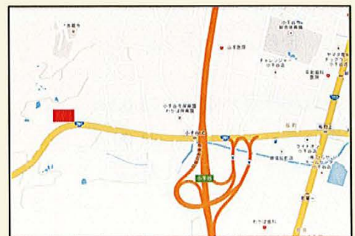
小千谷ICより車で2分