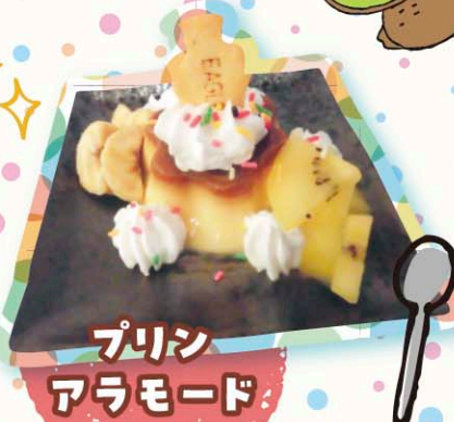
プリンアラモード